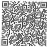
まちピカ App Store

まちピカ町田くんは道路の見にくくなった白線や破損箇所をスマホで撮り位置情報を送ることでメールや電話よりもいち早く道路課に通報するものです。町田市ごみ分別アプリは地域に合わせたごみ出しの日をプッシュ通知機能でのお知らせや地域別のごみの分別・出し方などをアプリで紹介しているものです。先日も町田市内でごみ収集車やごみ収集施設でも火災事故がありました。小さな事かもしれませんが、ごみを正しく出し事故を防ぎSDGsへも取り組んでいきましょう！QRコードもご用意しましたので是非ダウンロードしてお試してください。