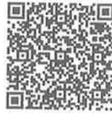
ごみ分別 App Store