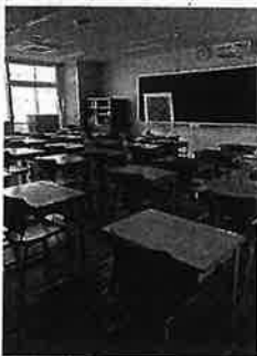
町田第一中学校の新しい教室

町田市立第一中学校校舎の改築工事が完了し、2学期から新校舎での授業が始まりました。内覧会では、空調設備、LED照明、バリアフリー化のほか、地域との交流や災害時の避難施設機能を持ったホールを視察しました。普通教室には全室プロジェクトやWiFiが整備され、図書室の本棚や机はすべて木製で落ち着いた雰囲気でした。長い期間、プレハブ校舎で不自由な思いをした生徒たちが心待ちにした新校舎。日本共産党市議団は、雨もりなど老朽校舎の状況を調査し、早期建て替えを求めています。