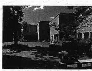
芹ヶ谷公園内の市立国際版画美術館

市立国際版画美術館は 「気品に満ちた文化的・芸術的建物」 設計者が、市の工事差し止め「申し立て」