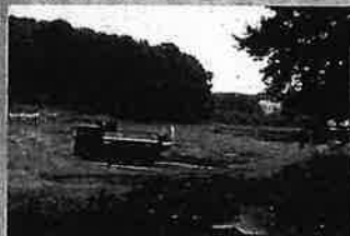
野津田公園のばら広場跡地

2020年度一般会計特別会計決算認定審査における共産党市議団の反対討論の要旨を紹介いたします。新型コロナウイルス感染が拡大する中、PCR検査センターの早期立ち上げや介護施設等での検査、業者への家賃補助を実施したこと。中学校全員給食実施の決定、全小中学校体育館へのエアコン設置など市民要求を反映した取り組みを評価しました。同時に、以下の5点の問題を指摘。第1に、長寿号や奨学金制度の廃止、障がい者家賃補助削減など市民の暮らしを支えてきた福祉、教育の廃止・削減です。第2に、国保税5年連続値上げなど、市民負担増が行われたこと。第3に、公共施設再編で図書館の削減や学校統廃合計画を進めてきたこと。第4に、市民の声に反して芦ヶ谷公園や野津田公園の整備計画を進めてきたこと。第5に、モノレール延伸を前提にしたまちづくりを進めてきたことです。「4つのもり」整備に莫大な税金を投じながら、市民の暮らしに負担を増やし、福祉、教育の削減が行わ