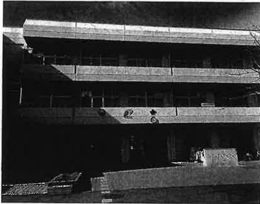
市立小中一貫校ゆくのき学園校舎

町田市立小中一貫校ゆくのき学園（大戸小、武蔵五中）を廃校にしないでほしいという請願が今議会に提出され、全会派賛成の圧倒的多数で採択されました。市教育委員会は、5月に策定した「町田市新たな学校推進計画」の中で、小学校42校を26校（廃校は18校）に、中学校20校を15校（廃校は6校）に統合するとし、ゆくのき学園も含まれていました。請願者は陳述で、児童生徒一人一人にきめ