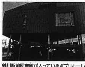
鶴川駅前図書館が入っているポプリホール

市立図書館全館に指定管理者制度を導入できるように条例を改定する「図書館条例」が出され、日本共産党のみ反対の賛成多数で可決されました。2022年度から鶴川駅前図書館に指定管理者導入が予定されています。図書館への指定管理者制度導入については、公立図書館の公共性、無料の原則や社会教育の基幹的な施設という特質から、民間企業が担うことはそぐわないと考えます。全国的には、指定管理者制度から直営に戻すという自治体の事例も増加する中、指定管理者制度導入の決定過程については、十分な議論や市民への説明も全く足りていないことを共産党市議団は繰り返し追求してきました。町田市は、鶴川駅前図書館でたった2年間の効果の検証後に、他の地域館にも指定管理を導入する計画です。引き続き、各地域図書館を市が直営で運営することを求めていきます。同時に、図書館を8館から6館に減らす計画もストップさせ、公立図書館を守るためにがんばります。