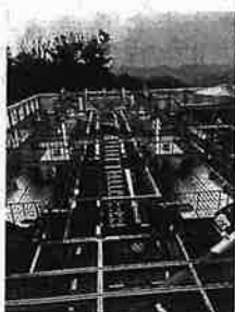
メタンガス発酵槽