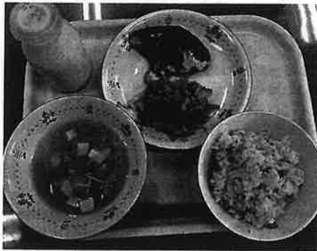
町田市内の小学校給食試食会 (2018.10)

町田市の中学校給食が大きく前進します。今年1月の「町田市学校給食問題協議会」の答申をうけ、教育委員会は成長期の中学生全員に安全・安心で、栄養バランスが整えられた「温かい給食」の提供をするため、新たな中学校給食の提供方式として「全員給食・給食センター方式」の導入を提案しました。2021年度予算