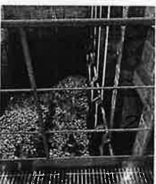
バイオエネルギーセンター内の ごみピット

新しいごみ焼却場は、「町田市バイオエネルギーセンター」と名称を変えて2022年1月から稼働します。燃えるごみは、2つの炉で1日258トン、生ごみはバイオガス化施設で乾式高温メタン発酵(50トン/日)、不燃・粗大ごみは47トン/5ヵ所処理できます。10月12日に試運転中の施設を視察しましたが、総整備費309億円、今後19年3か月の運営委託費169億円(年間委託費8億8千万円)のバイオエネルギーセンターには、市民が利用できる会議室(有料)や見学コースが設けられるほか、リサイクル品展示コーナーも戻ってきます。コロナ禍で町田市でも家庭から出されるごみが増えていきます。「作らない・燃やさない・埋め立てない」の基本理念を市民協働で進めるためにも、ごみ減量(3R)は事業者へ丸投げではなく、市の職員が市民目線ですっかり関わっていくことが必要です。また、2か所の廃プラスチック中間処理施設(廃プラ資源化施設)の整備は、地域住民の理解と合意のもとに進めるべきです。