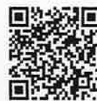
携帯QRコード でブログ閲覧