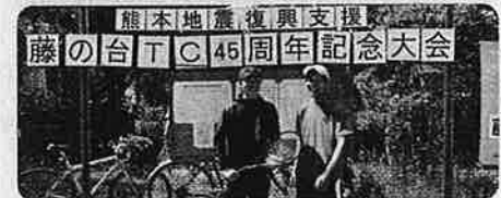
↑地元でのテニス大会に参加