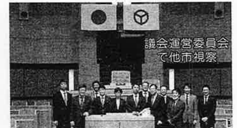
議会運営委員会 て他市視察

もちろん、町田市議会で不足点もあります。それは「政策条例」と呼ばれる分野で議員立案が進んでいないことですが、個々の議員の調査能力を向上させる努力とともに、議会の会派が協調して自主的にその目標設定を示すことが肝要なのではないかと考えています。