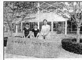
市議会の見学・傍聴