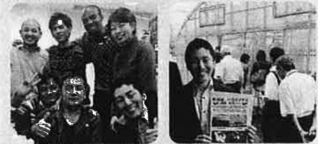
↑各国の方々と国際交流 ↑農業委員会視察