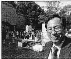
双方向の情報交流