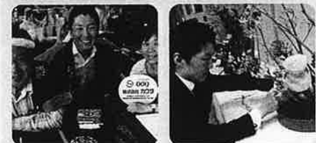
↑町田市内お祭り回り ↑町田市民文化祭では華道に挑戦