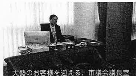
大勢のお客様を迎える、市議会議長室

なお、前から説明している通り、議員の報酬は独自に設定するルールになっています。議員の年俸は、3年前に引き下げており、その後一度も改定しておらず、市長との差が広がるばかりです。この関係でみると、議会が職員・市長の給与アップを容認することは不思議としか言えないと思います。