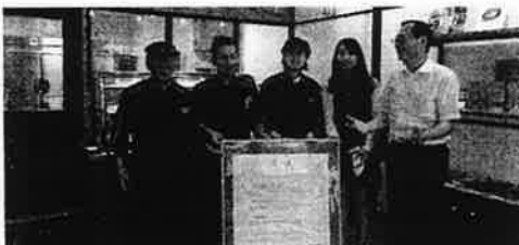
記事とは別。簡素な障がい者施設も訪れる。

この障がい者複合施設がこの場所だけのものか、あるいは今後の町田市の在り方を示すものが問われることを述べました。思うに、もし、この1か所に統合事業の障がい者施設があるのであれば、他の施設に対して今後の運営に大きな責任があることを述べました。エピソードとして、最近訪れて、私が昼食を頂いた障がい者施設の共働学舎の食事提供部門(喫茶・食事)とあまりにも違っていました。果たして、この「新ニューズセンター 花の家」のような施設が増えていくのでしょうか。私には、そうした予算編成が可能かと言えば、かなり難しだろうと思う次第でした。逆に、他の障がい者施設において、厳しいマイナスの予算措置を求められていることに落差と違和感を感じています。