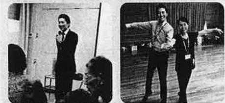
↑高齢者見守り支援ネットワーク ↑4年ぶりの社交ダンス