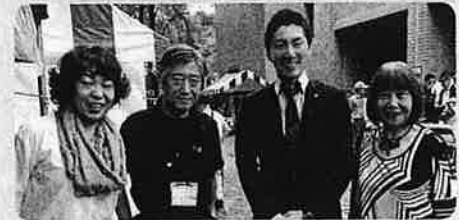
↑版画美術館でゆうゆう版画まつり