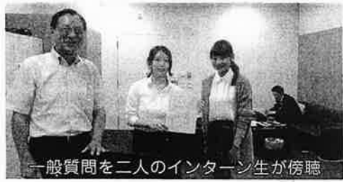
一般質問を二人のインターン生が傍聴

その新駅が相模原市緑区橋本に地下駅として造られますが、私の提案は町田市もその新駅ターミナル建設に参画して、必要な費用負担をするべきだということです。例えば、小田急多摩線延伸の共同調査においては、相模原市と町田市は費用折半として、毎年約1000万円の支出を行っています。私は、今回の一般質問で「橋本」のリニア中央新幹線駅ターミナルを町田市が相模原市と一緒に建設し、その運営を行うための共同研究を持ちかけましたが、町田市は利益教授のみを求めるのみでした。資金を出さないで、相模原市から有効な利益を受け取るとは思えません。私は、町田市はこの2027年に起きるリニア時代に取り残される懸念を強めました。