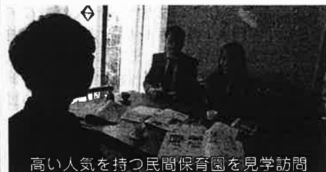
高い人気を持つ民間保育園を見学訪問

国が子育て世代の就労の拡大を求め続けることに無理があり、むしろ、所得補償で子育てを考える方がより良くなるとする見方が地方議会では芽生えています。私は多数が保育施設に預ける時代に、公設認可の施設が低料金で高いサービスを提供し、逆に、認証・無認可の施設が高料金でサービスが低い内容を提供する事態の改善こそが課題だと思っています。