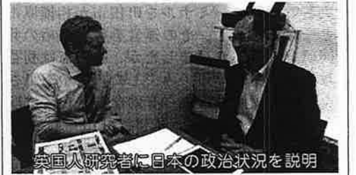
英国人研究者に日本の政治状況を説明

今期の補正予算で、「アクティブシニア介護人材バンク事業」と言う制度の新設事業(予算額1千万円)がありました。東京都が全額を支出する(3年間)制度ですが、50歳代以上(上限は無い)の人が一定の講習を受け、登録をした上で、介護の現場で新たに働くことで慢性的な就労者不足を補おうという仕組みです。東京都は、期間を過ぎると予算を無くす可能性もあり、事後その任を基礎自治体(町田市)が負わされる懸念もありますが、今日的な課題であることは間違いありません。人が60歳代を越しても就労する状況は当たり前になってきており、このことは、ある意味、以前には3Kと呼ばれた職務に高齢者が多数就業し、雇用者不足を補うことを下支えする事態が生じているとの構造ができつつあることを示しています。