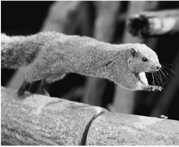
町田リス園の台湾リス

秋田じづか(諸派) ○ 医療的ケア児の保育所等受け入れにあたり、ガイドラインを見直しはどうか。 子ども生活部長 他市が策定しているガイドラインや有識者の意見を参考に、保育所等で実施する医療行為の範囲や対象年齢等に加え、入園可否の判断基準や手続方法など、様々な検討を進めています。 ○ 病児・病後児保育の対象年齢を6年生までに拡大し 子ども生活部長 施設の設備面などの課題があるため、すぐに実施することは難しいと考えています。今後は他市の動向を注視してまいります。 ○ 町田リス園の基本計画策定にあたり、現在運営している町田リス園が協議に加わることは可能か。 経済観光部長 町田リス園から状況をお聞かせいただく機会を確保していきたい。