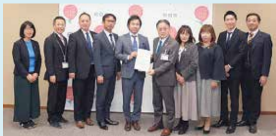
2023年12月22日に、意見交換会の実施報告書を市長へ提出しました!