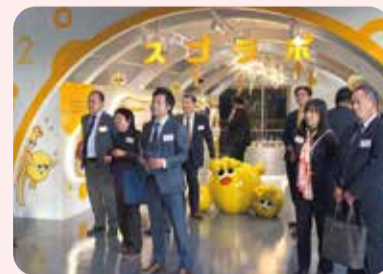
町田市バイオエネルギーセンターでの施設見学の様子

11月16日に町田市において、4年ぶりの開催となる、町田、相模原両市の議員による議員交流会が行われました。