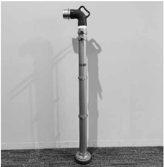
スタンドパイプ: 消火栓に差し込み、ホース・筒先を結合することで、毎分100リットル以上の放水ができる消火用機材