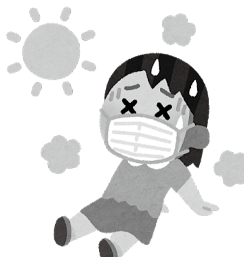
夏のマスク着用は熱中症に注意!