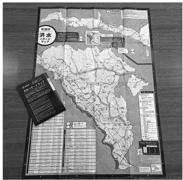
町田市洪水ハザードマップ

都市づくり部長 実現に至っていない状況で、原因は運転士不足と聞いています。引き続き、バス事業者に増便の申し入れを続けていきます。