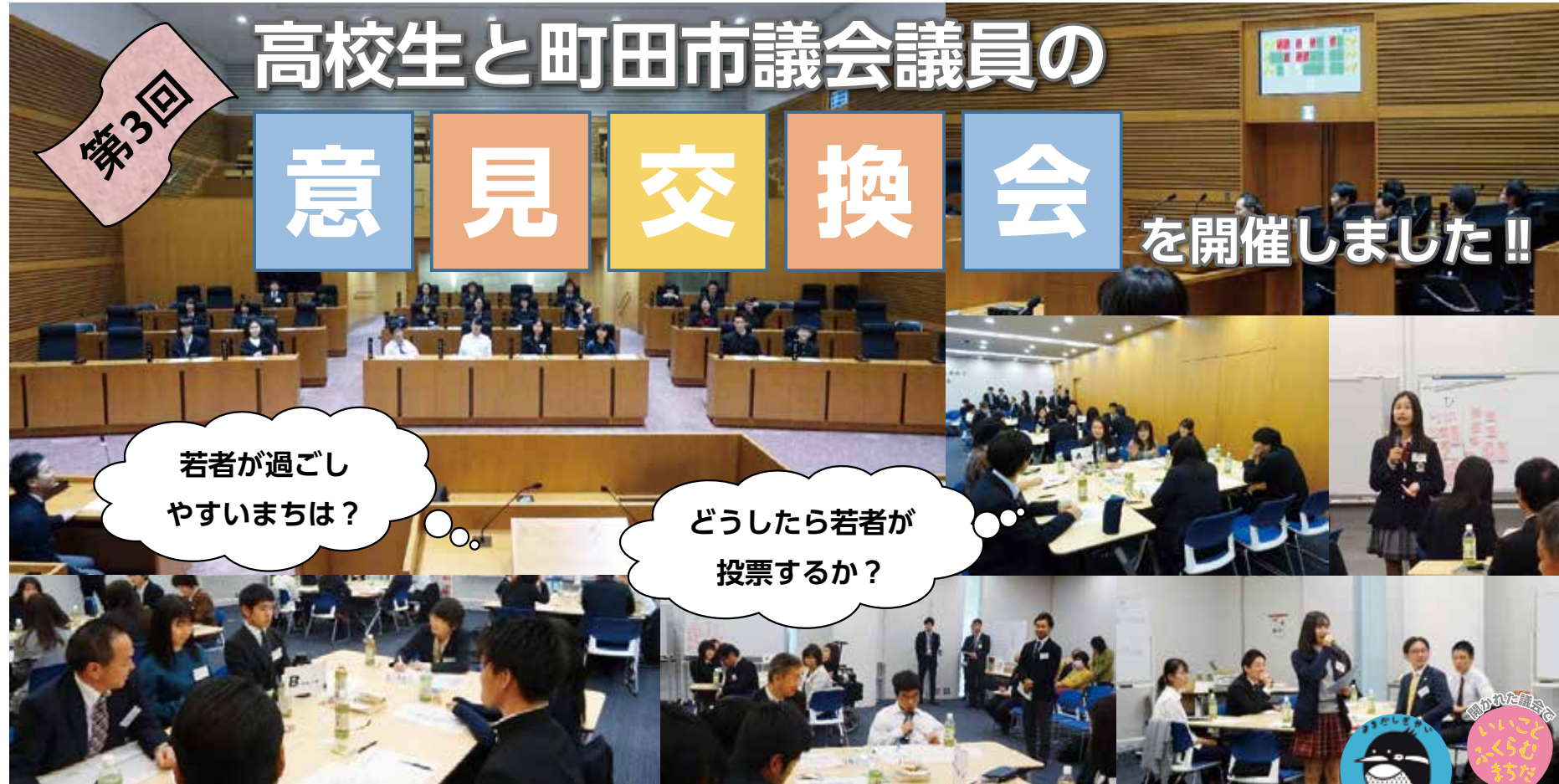
11月9日（土）に開催された「第3回 高校生と町田市議会議員の意見交換会」の様子