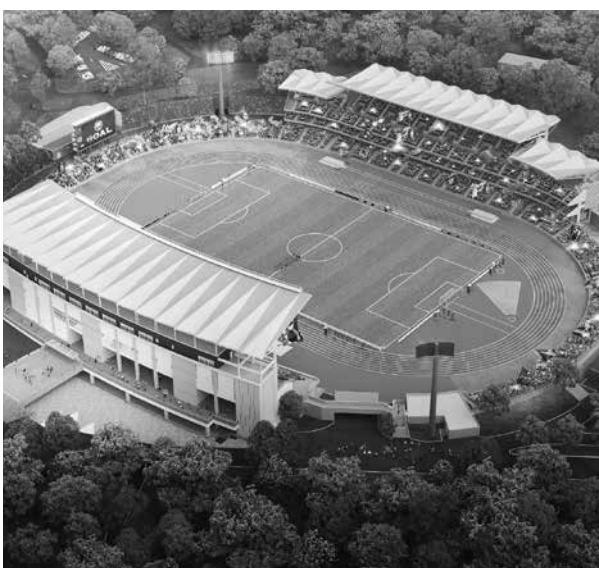
町田GIONスタジアム(町田市立陸上競技場) 工事完了後のイメージ図