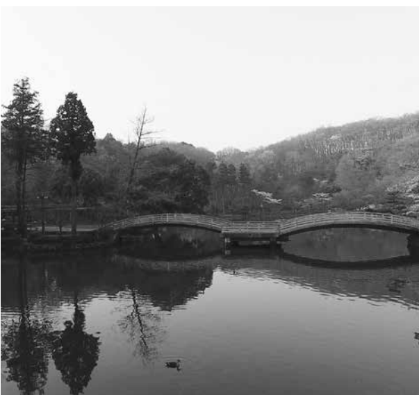
町田薬師池公園 四季彩の杜 薬師池

副市長から赤旗は物品だから市の全施設で販売、購入も全て禁止するとの依命通達が出された。共産党の規則違反は許されない。管理が甘いとこの結果になる。