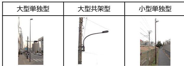
標準的な街路灯の写真