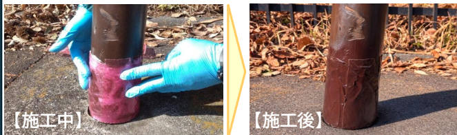
事例)FRP※シートを用いた簡易工法(町田市)

街路灯の根入れ部分にシートを貼り付けて、根入れ部分の劣化を抑制する措置である。紫外線により比較的短時間で硬化することが特徴で、簡易に実施できる。