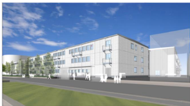
<仮校舎のイメージ図>

南第一小学校は単独で建替えます。2027年度から旧校舎の解体及び新校舎の整備工事を行い、2030年度から新校舎を使用開始する予定です。建替え中は、南中学校の敷地に建設する仮校舎を使用します。仮校舎の建設は2026年2月に着工しました。引き続き、中学校との調整や引越しの準備を進めていきます。なお、新校舎については2025年度中に基本設計が完了する予定です。