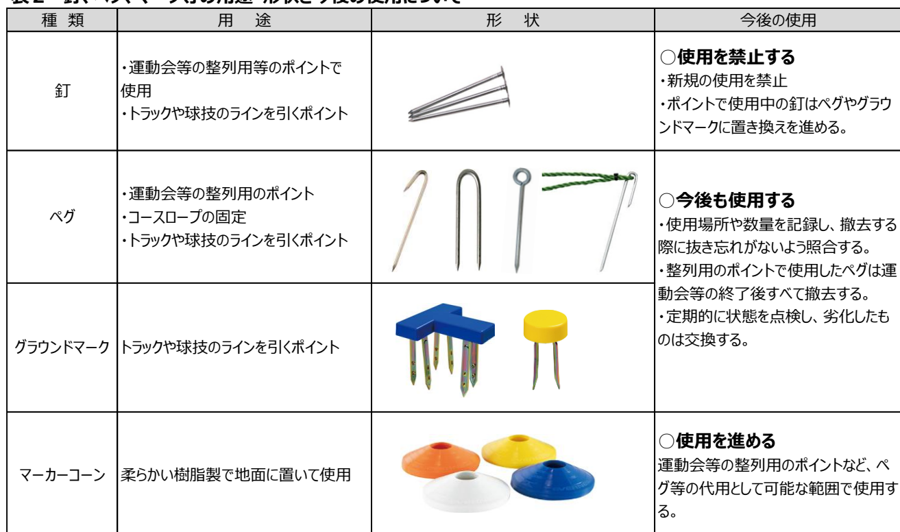
表2 釘、ペグ、マーク等の用途・形状と今後の使用について