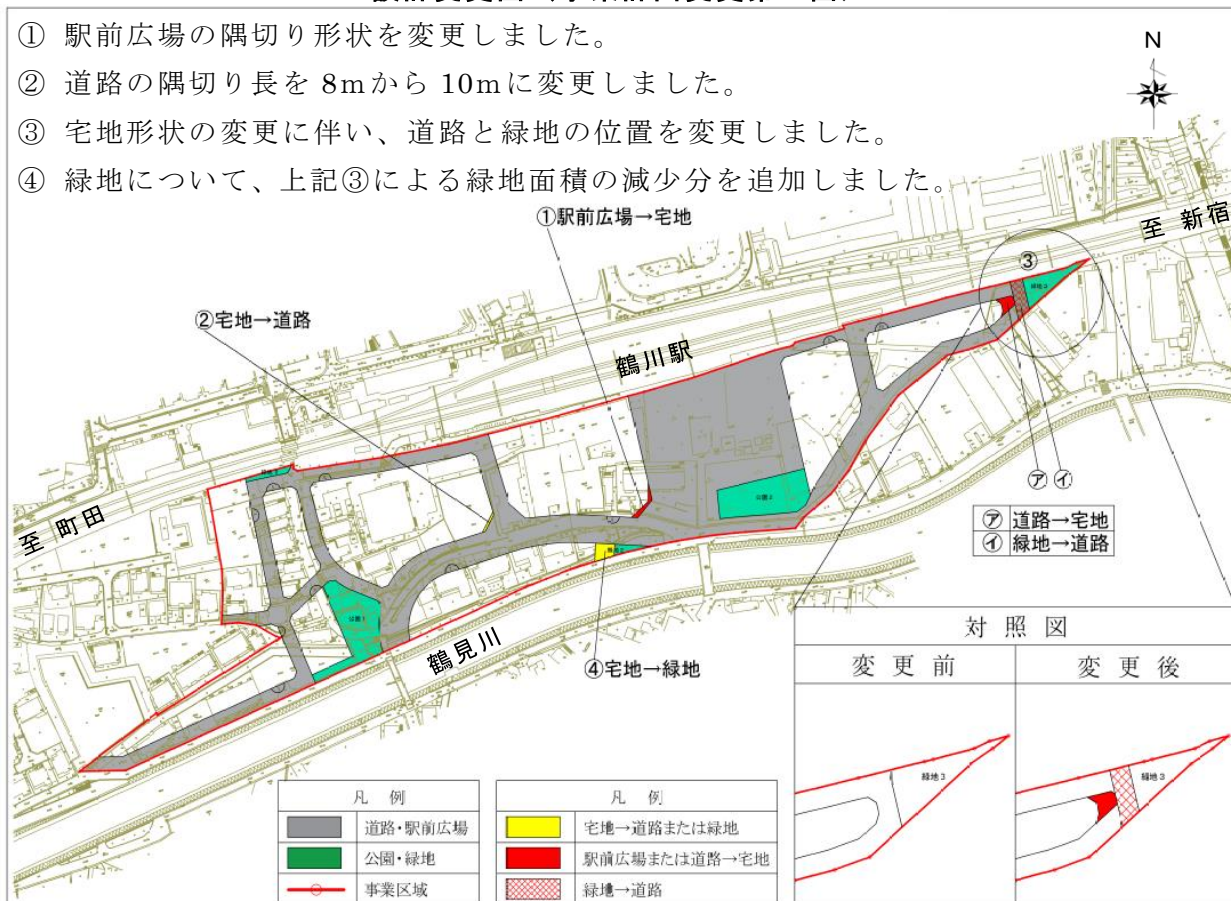
設計変更図(事業計画変更第一回)