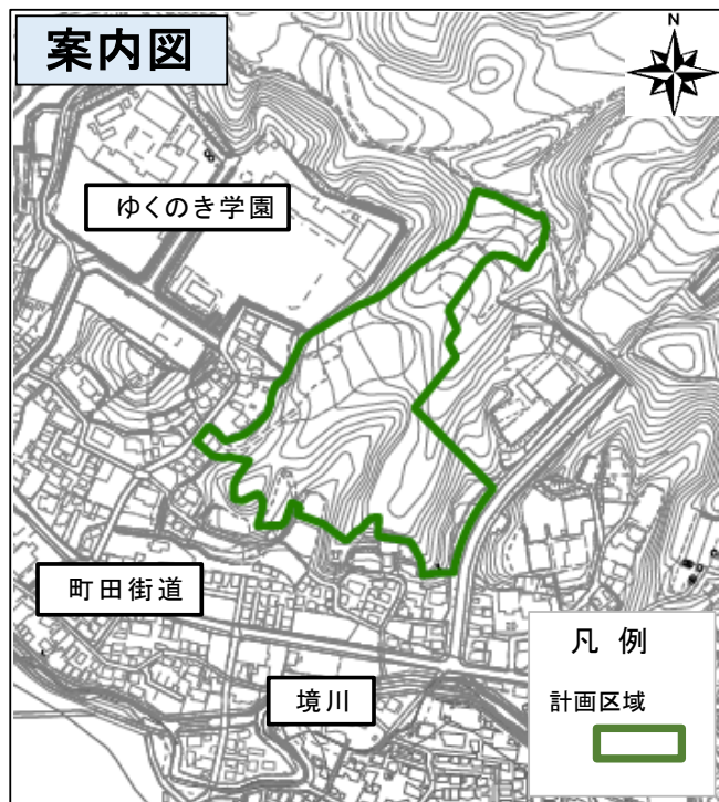
平面図 (相原町字大谷戸)