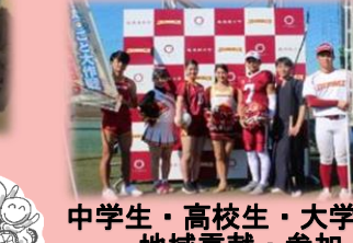
中学生・高校生・大学生の地域貢献・参加