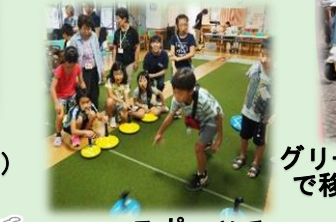
ニュースポーツで多世代交流