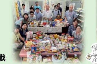
小山・小山ヶ丘つながるフードドライブ大作戦