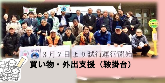
3月7日より試行運行開始 買い物・外出支援（鞍掛台）