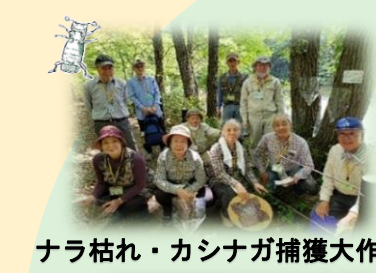
ナラ枯れ・カシナガ捕獲大作戦