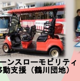
グリーンスローモビリティで移動支援（鶴川団地）