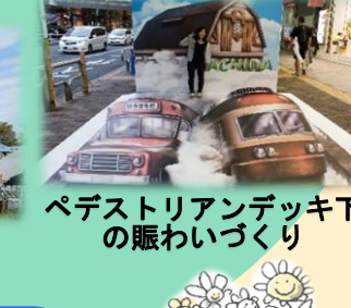
ペDESTリアンデッキ下の賑わいづくり