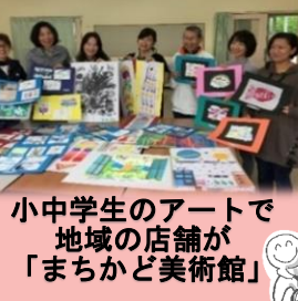
小中学生のアートで地域の店舗が「まちかど美術館」