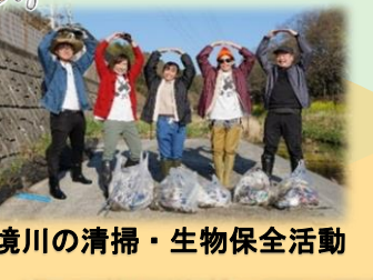
境川の清掃・生物保全活動