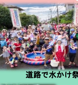
道路で水かけ祭り