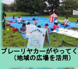
プレーリヤカーがやってくる（地域の広場を活用）