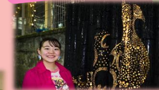
相原地域（竹）×大学生