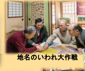
地名のいわれ大作戦