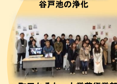
町田かるた×大学芸術学部