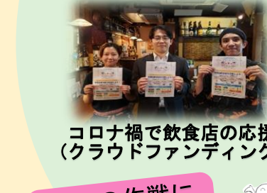
コロナ禍で飲食店の応援（クラウドファンディング）