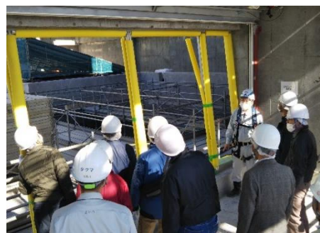
<写真：地区連絡会委員見学の様子>