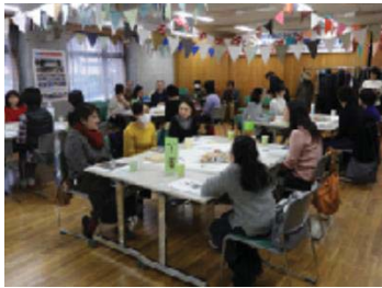
【地域住民との対話事業】

地区協議会には、町田市町内会・自治会連合会の地区連合会、町田市青少年健全育成地区委員会、町田市民生委員児童委員協議会の3団体が参加しています。その他の構成団体は、各地区協議会で異なっており、小・中学校や高校、大学、社会福祉法人、消防団など、様々な団体が参加・協力しています。