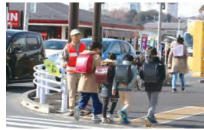
【安心・安全な街づくり事業】