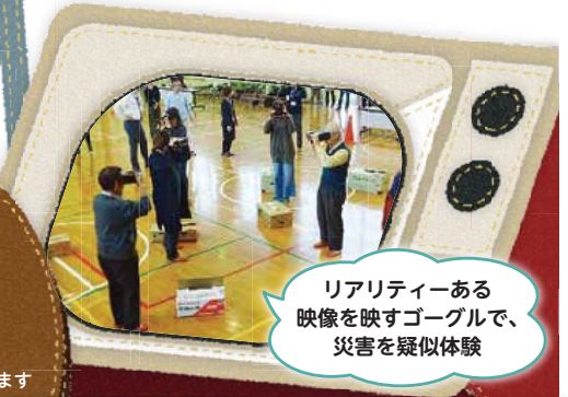
リアリティーある映像を映すゴーグルで、災害を疑似体験

木曾境川小学校の児童と木曾地区の住民と一緒に、VR(仮想現実)とAR(拡張現実)を使い、災害を疑似体験しました。子どもたちと住民で感想を共有し、地区全体で防災意識を高める取り組みになりました。