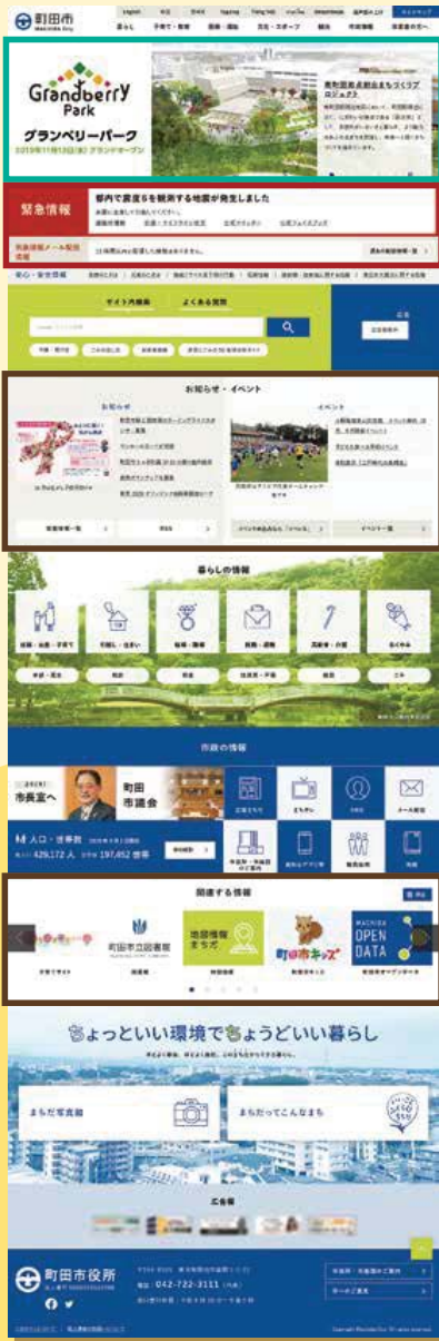
※画像はサンプルです