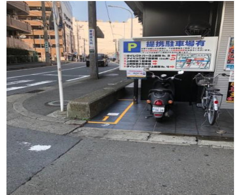
・駐輪場の例（神奈川県）