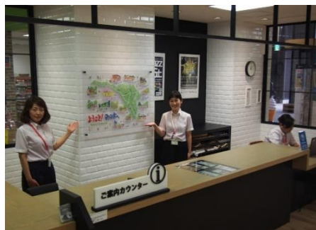
まちの案内所 町田ツーリストギャラリー