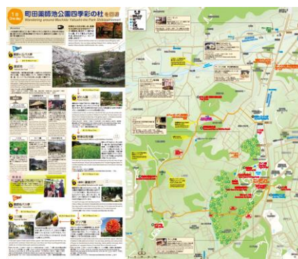
多言語の観光マップ