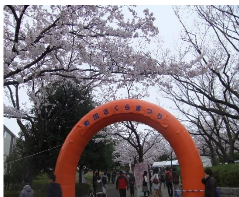
町田さくらまつりの様子