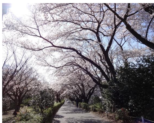
尾根緑道の桜並木