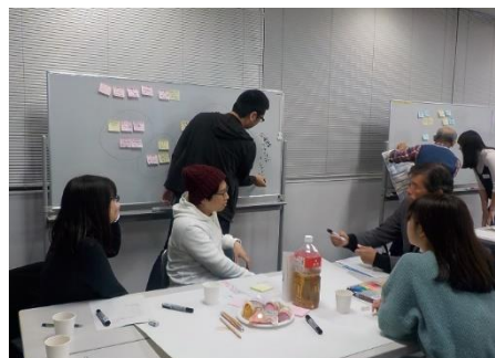
観光まちづくりワークショップ