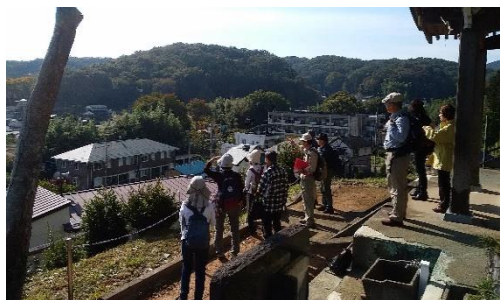
ガイドウォークツアーの様子