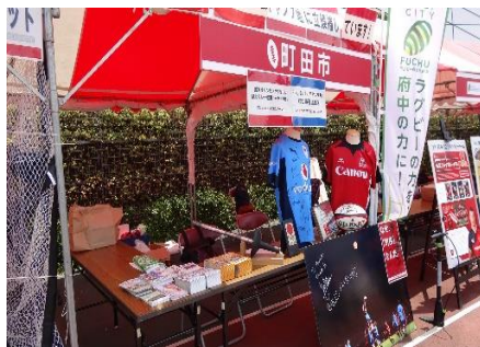
シティセールス活動の様子